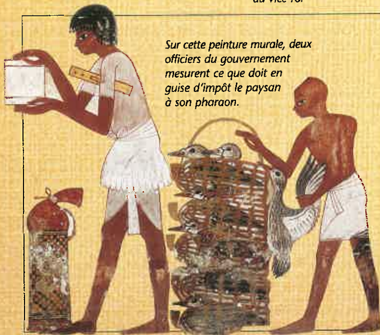
Sur cette peinture murale, deux officiers du gouvernement mesurent ce que doit en guise d'impôt le paysan à son pharaon.