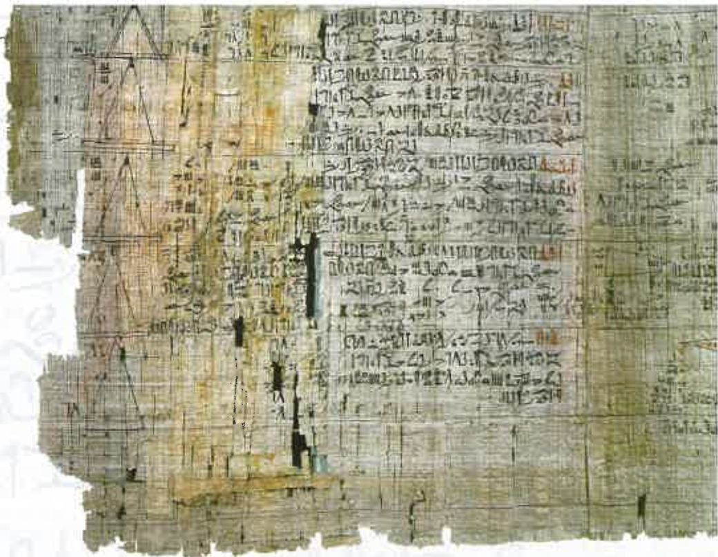
Le papyrus de Rhind (conservé au British Museum) décrit différents problèmes pratiques et mathématiques et les moyens de les résoudre.

Ce scribe en position assise, un papyrus sur les genoux, s'apprête à lire.