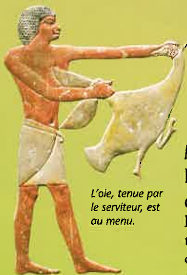
L'oie, tenue par le serviteur, est au menu.

Les aliments sont servis dans des bols, comme celui-ci en fûience datant de la XVIII e dynastie.