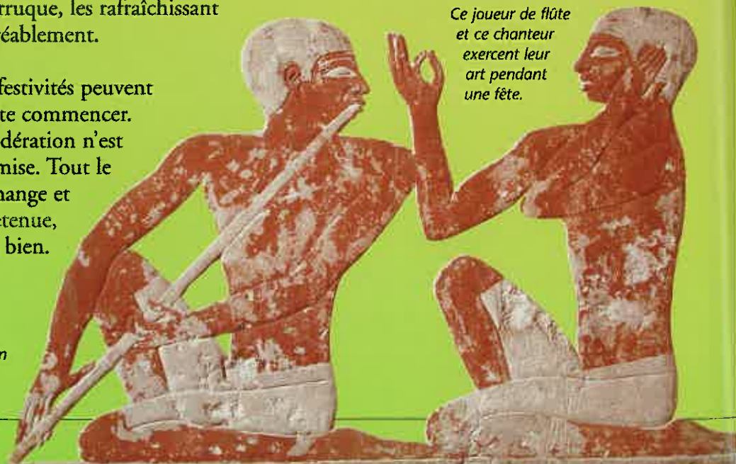
Ce joueur de flûte et ce chanteur exercent leur art pendant une fête.

Outre le vin et la bonne chère, toute fête digne de ce nom se doit d'organiser des spectacles. À l'arrivée des invités et tout le long du repas, des musiciens jouent de la harpe, de la lyre, de la flûte double et du tambour. Le repas terminé, c'est au tour des chanteurs et des conteurs, des danseurs, des acrobates et des jongleurs.